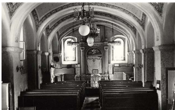
nová synagoga – pohled k východní stěně (foto kolem r. 1941)