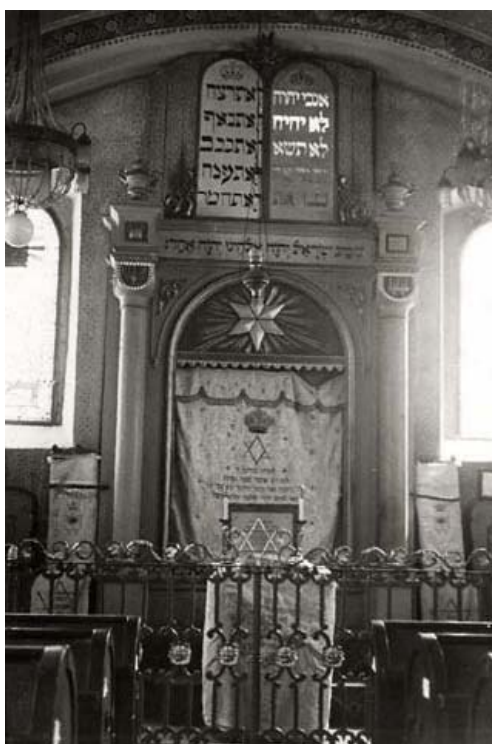
nová synagoga – aron ha-kodeš zakrytý oponou (foto kolem r. 1941)