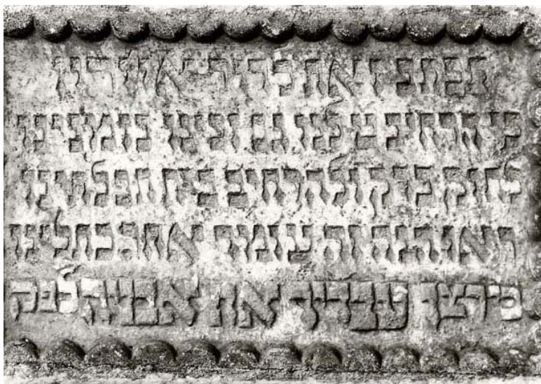
pamětní deska z roku 1820-21, připomínající zvětšení synagogy a původně zasazená v její stěně, dnes umístěná na novém hřbitově (foto kolem r. 1980)

1868 budova vyhořela, po požáru byla obnovena „do dnešní podoby“ ●●*N1