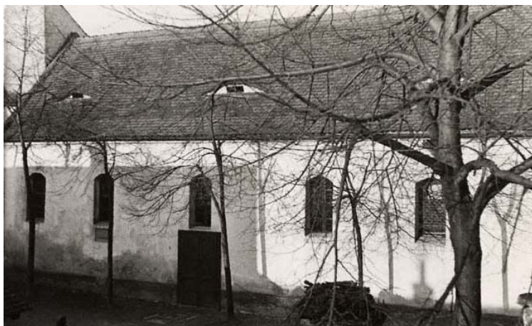
nová synagoga – jižní průčelí (foto kolem r. 1941)

2009 na obytném domě čp. 885 je pamětní deska připomínající synagogu ●●VNZ