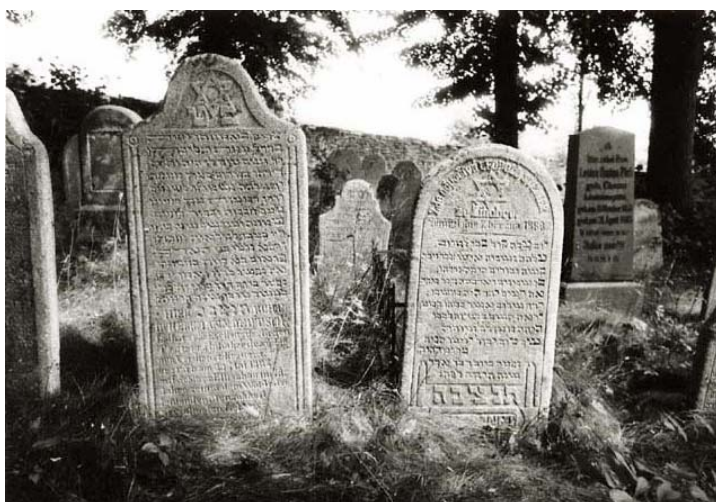
nový hřbitov – náhrobky s datem 1888 (foto r. 1997)