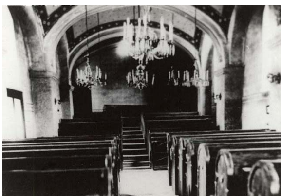
nová synagoga – západní strana sálu s vyvýšeným oddělením pro ženy (foto kolem r. 1941)