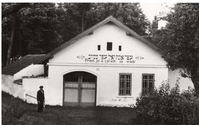
obřadní budova na novém hřbitově (foto kolem r. 1941)

2004 budova je už adaptovaná na rekreační domek ••RJC